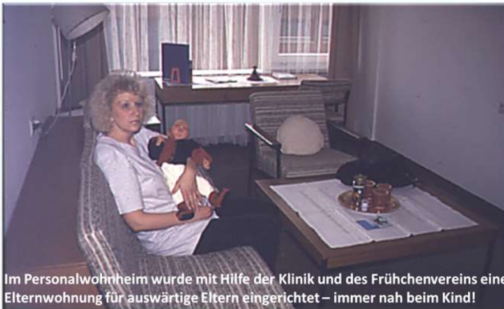
Im Personalwohnheim wurde mit Hilfe der Klinik und des Frühchenvereins eine Elternwohnung für auswärtige Eltern eingerichtet – immer nah beim Kind!

Vor 22 Jahren wurde 1998 wurde mit Unterstützung von Frühchen e.V. eine Elternwohnung im Klinikum am Steinberg eingerichtet. Verschiedene Modernisierungsmaßnahmen und Neuanschaffungen wurden von uns auch ganz aktuell finanziell unterstützt.