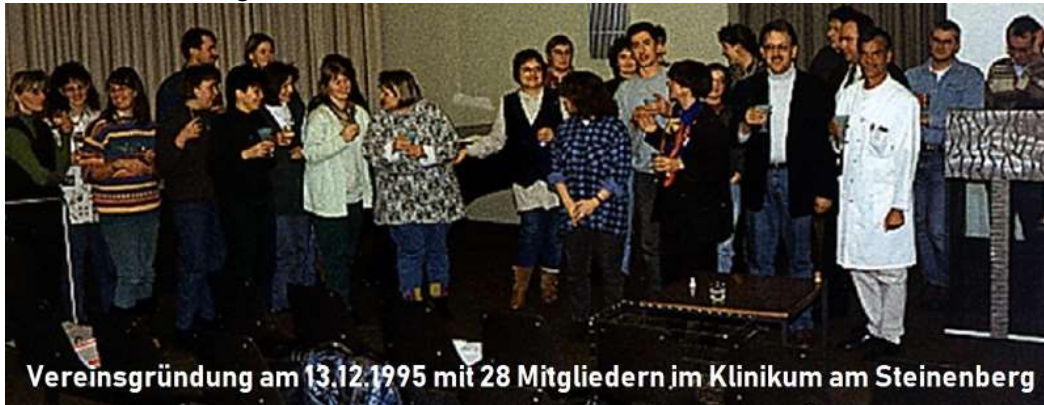
Vereinsgründung am 13.12.1995 mit 28 Mitgliedern im Klinikum am Steinberg

Frühchen e.V. wurde am 13.12.1995 gegründet und unterstützt seit bald 25 Jahren die kleinsten Patienten und ihre Familien der Klinik für Kinder- und Jugendmedizin in den Kreiskliniken Reutlingen.